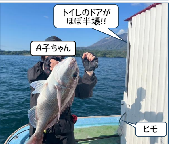
トイレのドアがほぼ半壊!!