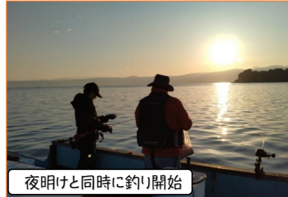
夜明けと同時に釣り開始