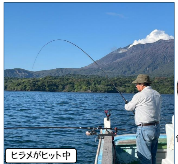
ヒラメがヒット中